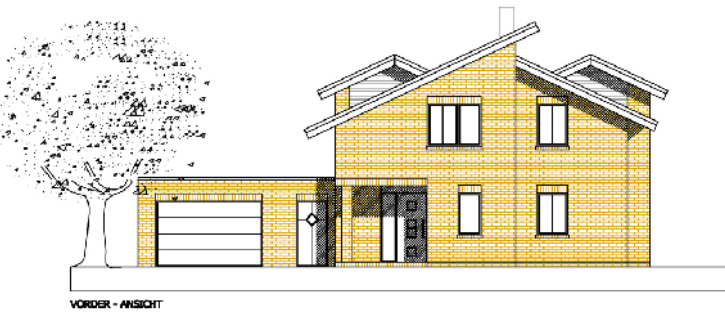
VORDER - ANSICHT