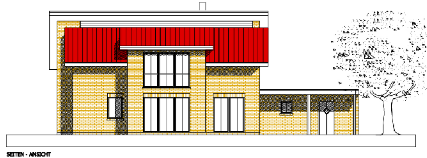
SEITEN - ANSICHT