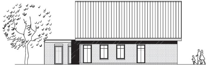
WEST - ANSICHT