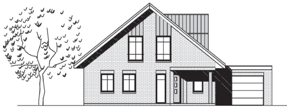
SÜD - ANSICHT