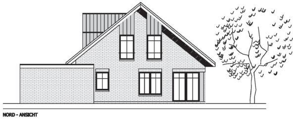
NORD - ANSICHT