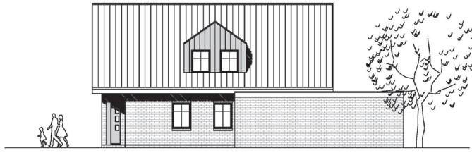
OST - ANSICHT