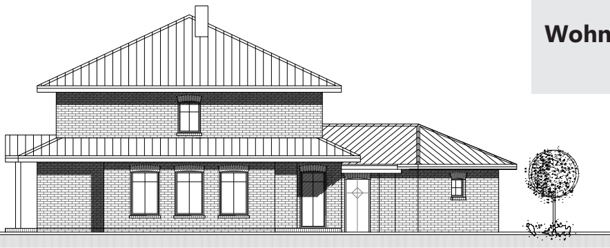
SÜD - WEST - ANSICHT