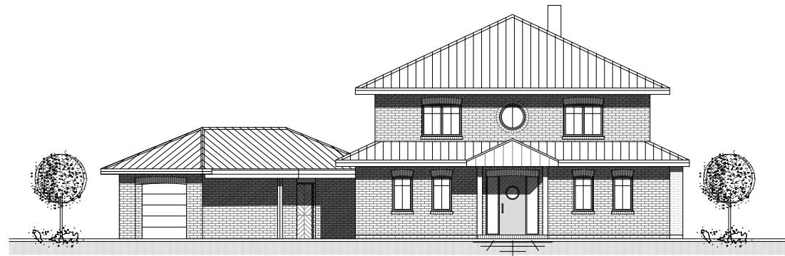
NORD - WEST - ANSICHT