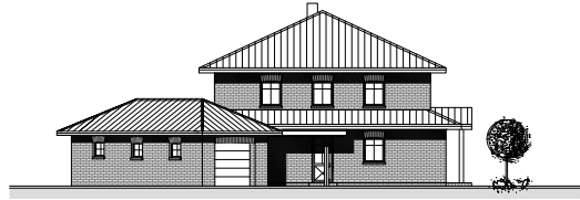
NORD - OST - ANSICHT