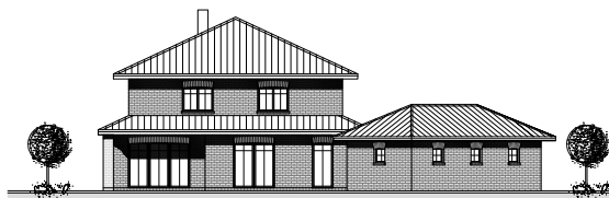
SÜD - OST - ANSICHT