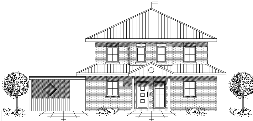
VORDER - ANSICHT