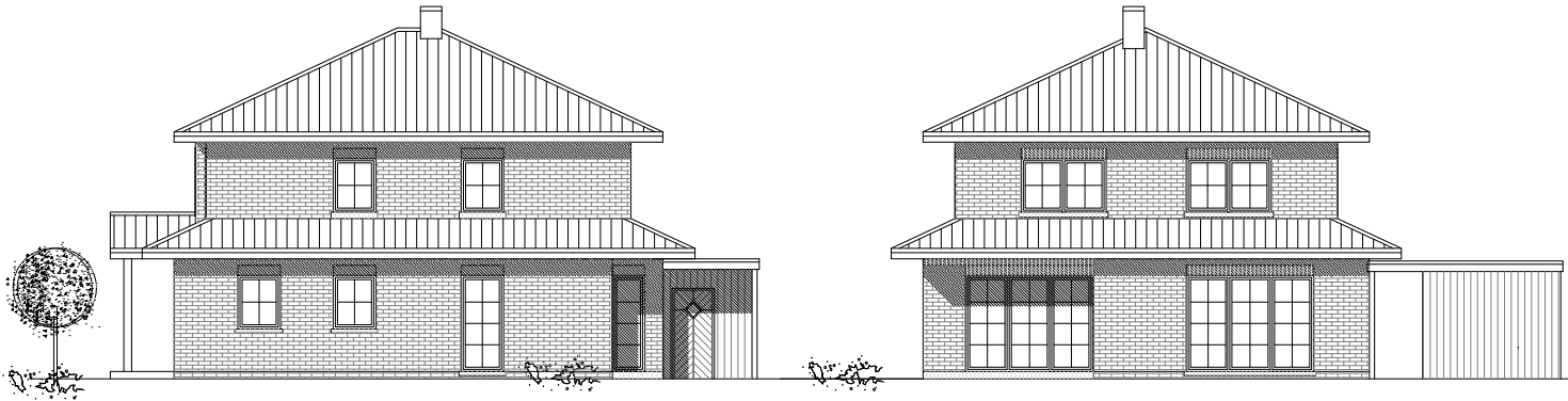
SEITEN - ANSICHT